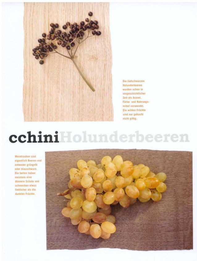
Heft 3/2004: Auf verschiedenen Furnierstückchen Holunderbeeren, Weintrauben, Paprika, Zucchini