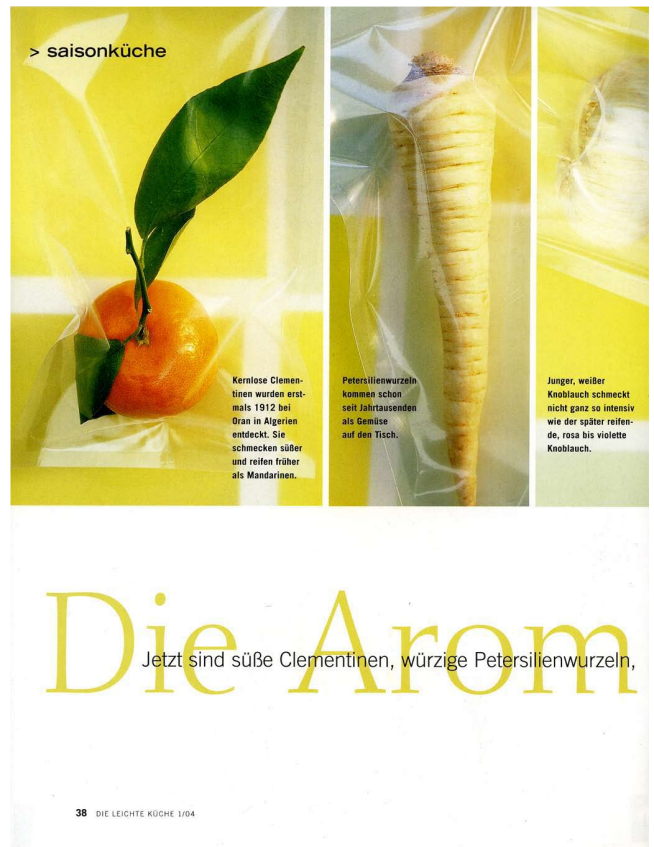
Heft 1/2004: Eingeschweißt in Folie Clementinen, Petersilienwurzel, Knoblauch, Lauch