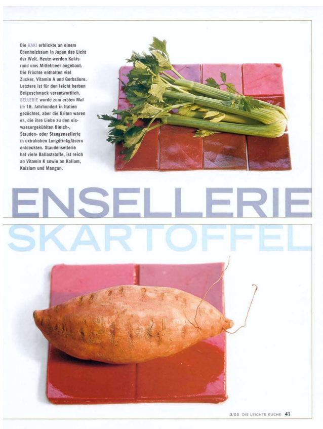
Heft 3/2003: Auf 1 - 8 Stück roten Glasfliesen Staudensellerie, Süsskartoffel, Khaki, Pflaume